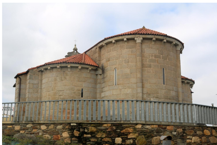
Igrexa de Santiago do Burgo