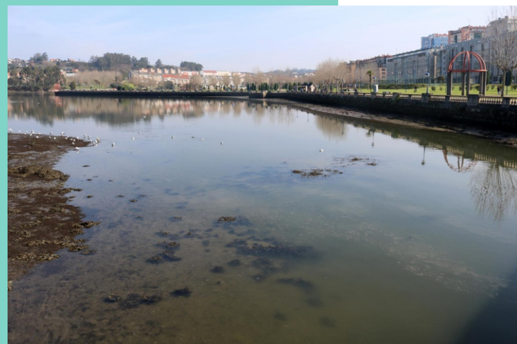
Desembocadura do rio Trabe