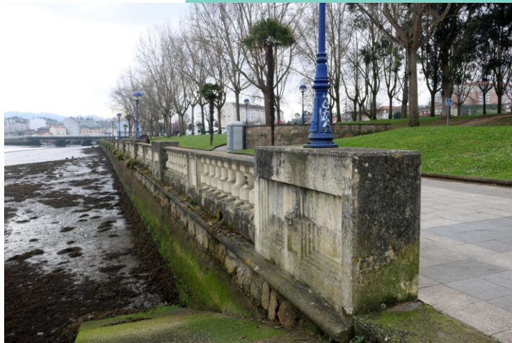
Paseo pola ría do Burgo