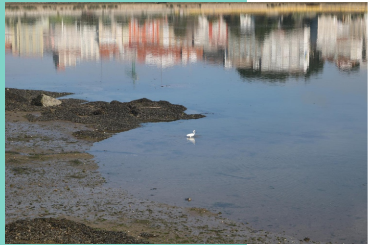
Garzota ( Egretta garcetta )