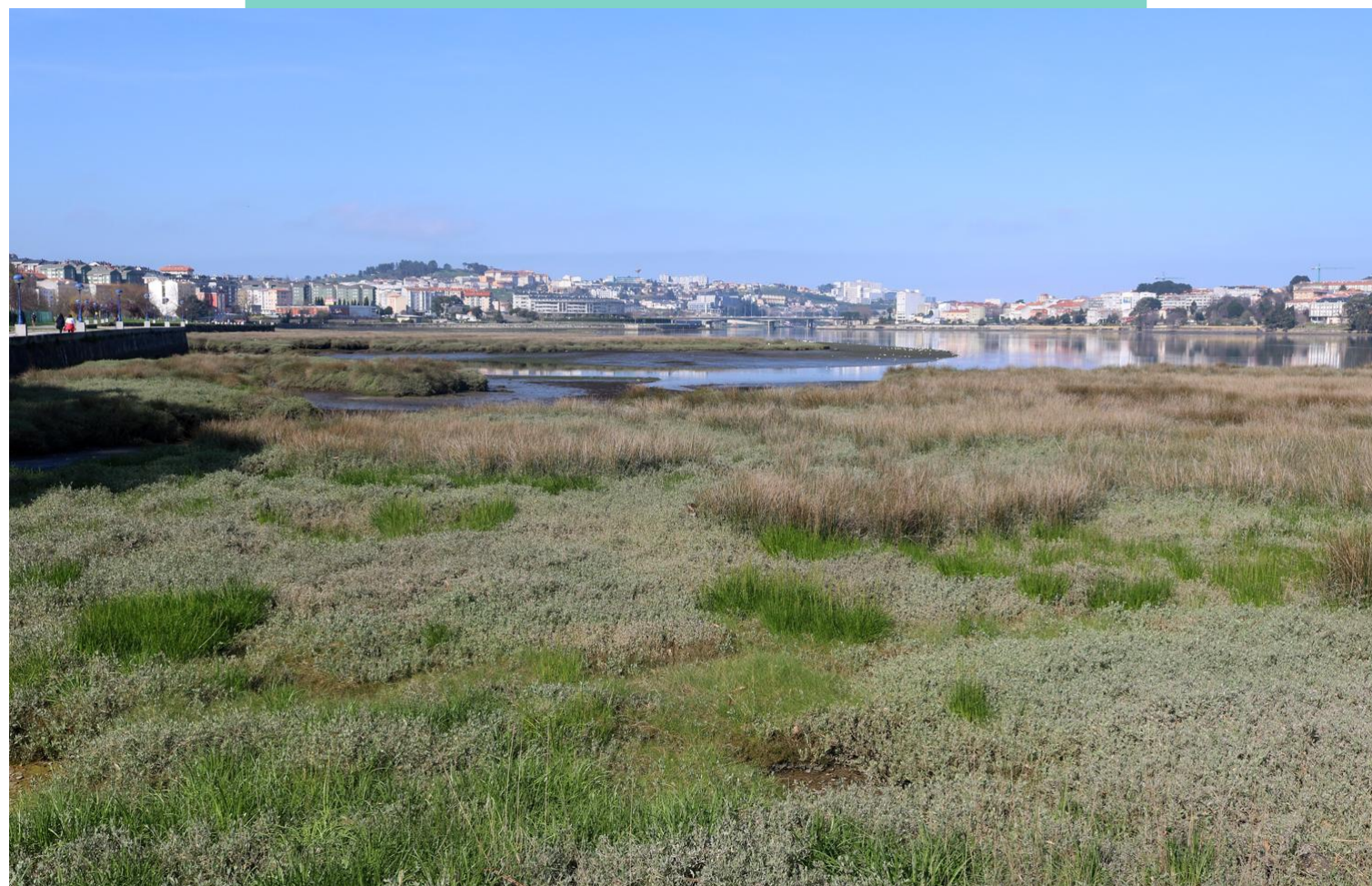
Plantas típicas de esteiros e marismas na ría do Burgo